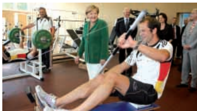
Krafraum: Weltmeister Max Hoff am Paddellitegerät