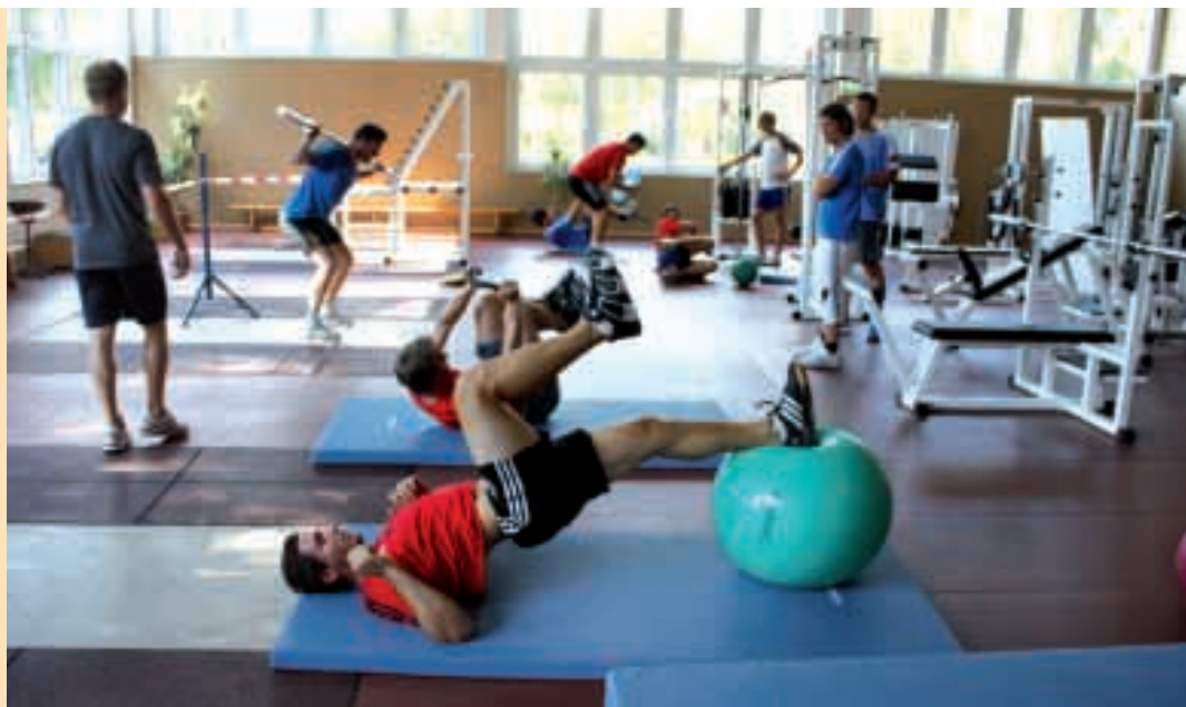
Kraftraum statt Skipiste. Für Deutschlands Slalom-Artisten heißt es in der Vorbereitungszeit auf den Winter, sich mit Gymnastik und Gewichten allmählich in Form zu bringen und die entsprechende Fitness zu holen.

Beim Vorbereitungslehrgang der deutschen alpinen Ski-Asse in Kienbaum, der übrigens genau mit dem Merkel-Besuch zusammenfiel, war bei dem Spross berühmter Eltern, der zweifachen