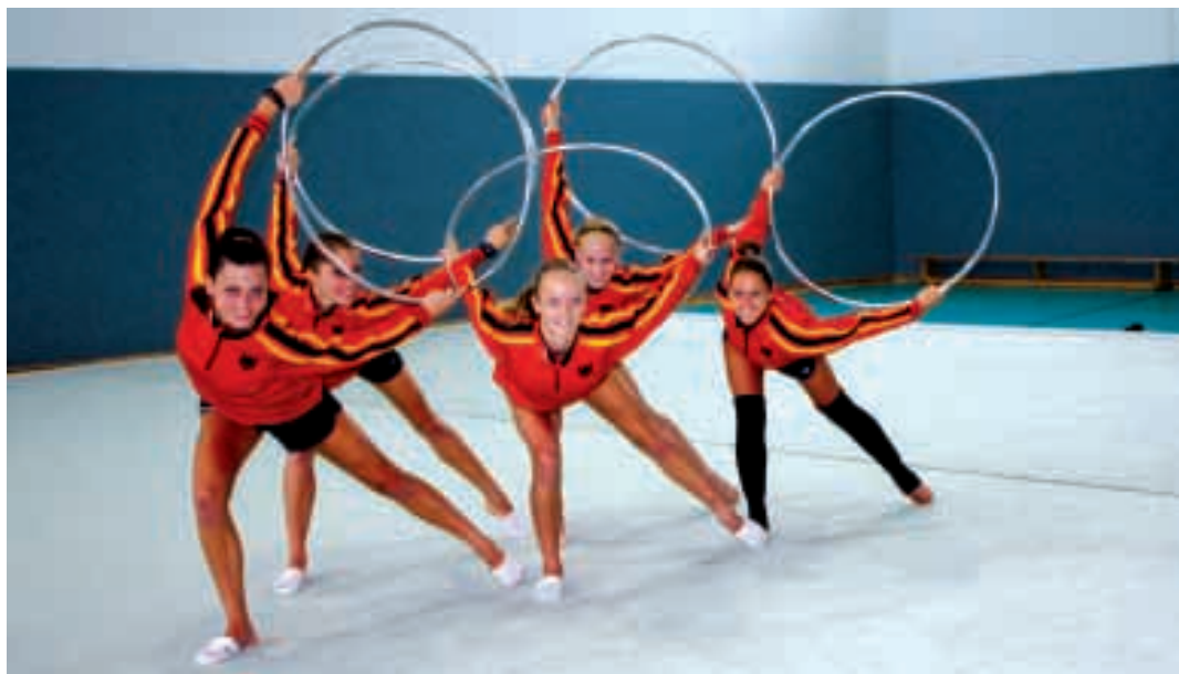
Reifen-Übung: Deutschlands RSG-Mädchen beim intensiven Training im Bundesleistungszentrum Kienbaum

"Unser Ziel ist aber schon ganz auf das nächste Jahr ausgerichtet",