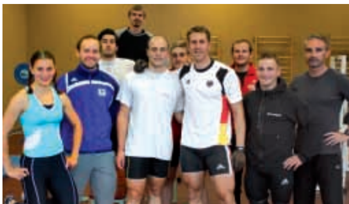
Ließen sich bislang nicht allzu häufig in Kienbaum sehen, doch inzwischen haben die Radsprinter die Vorteile der Anlage erkannt

Was allen positiv auffiel, das waren die kurzen Wege von einer Trainingsstätte zur anderen oder auch von der Unterkunft zur Mensa. Wobei als besonders lobenswert herausgekehrt wurde, dass in den Pavillons auch Waschmaschinen und Trockner vorhanden waren,