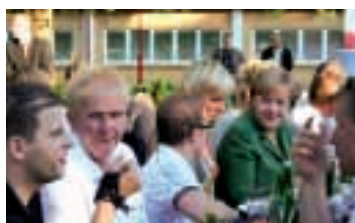
Nette Gesprächsrunde: Die Kanzlerin mit Sportlern