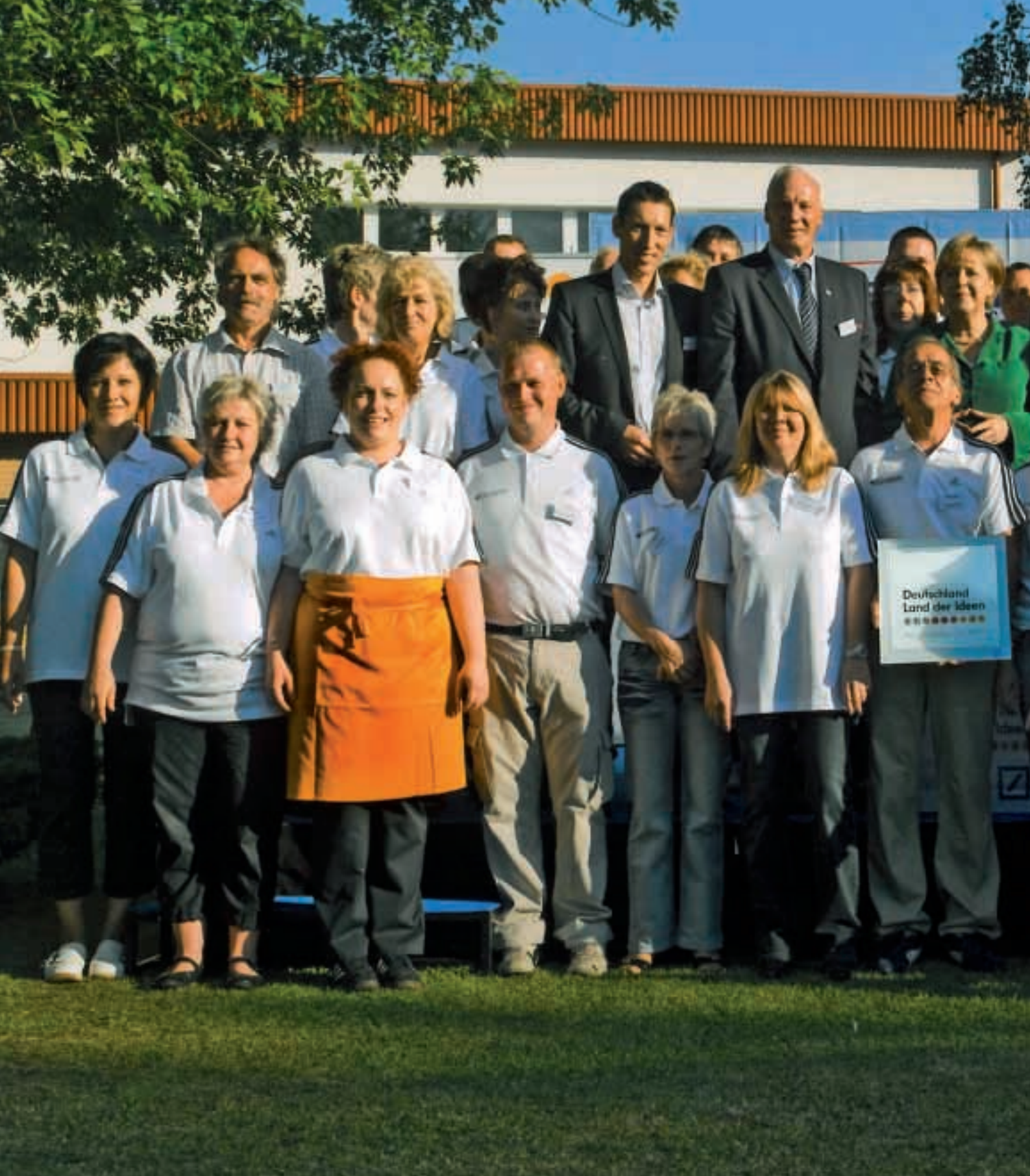
Besuch der Bundeskanzlerin im Bundesleistungszentrum Kienbaum am 19. Juli 2010