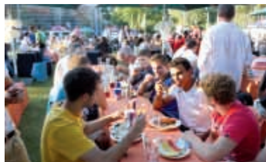
Sport macht Appetit. Die Volleyballer holten sich vom Grillstand Leckeres zu essen - und den Turnern schmeckt es bereits

Schon längst zu einer schönen Tradition sind die Sommerfeste in Kienbaum geworden. Diesmal fand bereits das siebente statt - und wieder einmal bei herrlichem Sonnenschein, so dass unter freiem Himmel in ausgelassener, fröhlicher Atmosphäre gegessen, geplaudert, gefachsimpelt werden konnte. Solch ein Abend bietet stets Gelegenheit dazu, dass sich Athletinnen und Athleten aus verschiedenen Sportarten besser kennen lernen.