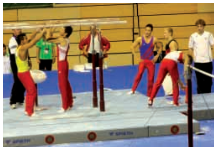
Fast die gesamte deutsche Nationalriege kümmerte sich bei den Titelkämpfen am Barren um die entsprechende Sauberkeit der Holme

verschleudert, so hat sich das geändert. Seit er sein Abitur in der Tasche hat und sich jetzt ganz seinem Sport widmen kann, spürt er, welche Möglichkeiten in ihm stecken und was man alles aus seinem Talent machen kann. Berlin lie-