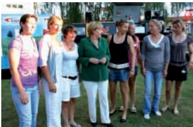
Deutschlands Kanutinnen nutzten die große Chance, sich einmal mit der Kanzlerin auf einem Foto verewigen zu lassen

Natürlich bildete der Besuch der Bundeskanzlerin nicht nur einen besonderen Höhepunkt, sondern für den Einen oder Anderen auch die Chance, mit Angela Merkel ein paar freundliche Worte zu wechseln oder, wie es die Kanutinnen getan haben, sich mit ihr gemeinsam fotografieren zu lassen.