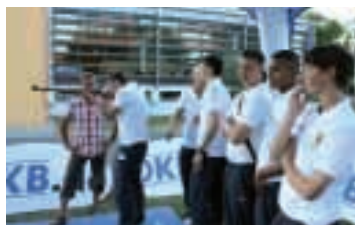
Action: Biathlet Frank Roetsch zeigt, wie ein Lasergewehr funktioniert