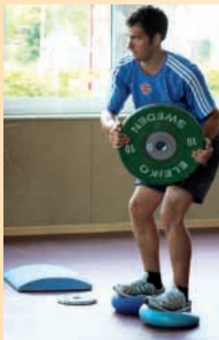
Kannte kein Pardon in Kienbaum und stand täglich in der Übungshalle, Felix Neureuther

einbezog, zumal er von Kollegen des Olympiastützpunktes München schon soviel Gutes von der Anlage gehört hatte und einige