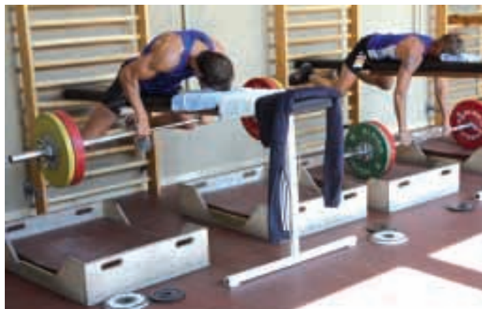
Quält sich mit Gewichten, um die Muskulatur zu stärken: Max Hoff, der Weltmeister im Kajak-Einer aus Köln

Inzwischen hat Hoff sein Biologie-Studium abgeschlossen und will jetzt an der Sporthochschule Köln seinen Dokortitel machen und natürlich weiter sein schmales Boot von Erfolg zu Erfolg steuern. Um das zu realisieren, will er auch jedes Jahr zum gemeinsamen DKV-Vorbereitungslager nach Kienbaum kom-