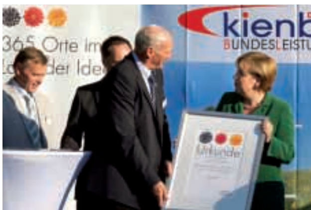
Höhepunkt ihrer Laudatio war die Überreichung der großen Urkunde "Ausgewählte Orte 2010", mit der insgesamt 365 Projekte in diesem Jahr in Deutschland ausgezeichnet wurden.