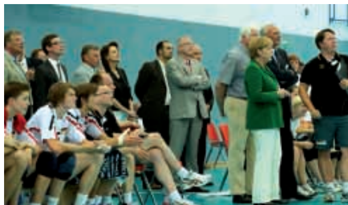
Volleyball: Deutschlands und Polens Junioren im Einsatz

Ähnlich äußerte sich Vesper, der da meinte: "Ohne die Anlage würden wir in Teilen des deutschen Sports nicht so gut dastehen, wie es augenblicklich der Fall ist." Er unterstrich, dass es richtig gewesen sei, sich für Kienbaum einzusetzen und für ein gesamtdeutsches Trainingszentrum zu plädieren, das inzwischen glänzend ausgestattet ist. Ähnlich äußerte sich DLV-Chef Clemens Prokop.