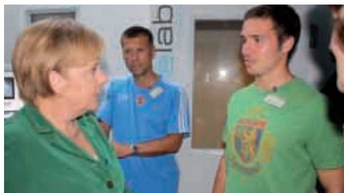
Kältekammer: Felix Neureuther berichtet über seine Erfahrung