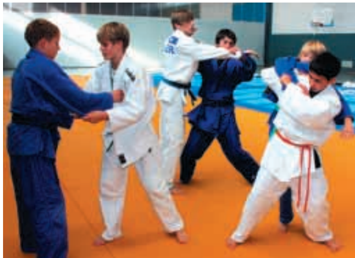
Verschiedene Griffe und Würfe wurden im Training geübt. Deutschlands Judo-Nachwuchs kam für fünf Tage nach Kienbaum

"Suche athletische Anschieberin, welche mutig und tough genug ist, mit mir durch die Bobbahnen dieser Welt zu fahren", lautete ihr Hilferuf. Folgendes Anforderungsprofil war zu erfüllen: Gewicht bis maximal 80 kg, Erfahrungen im Leistungssport (Leichtathletik, Gewichtheben oder eine andere Schnelldisziplin).