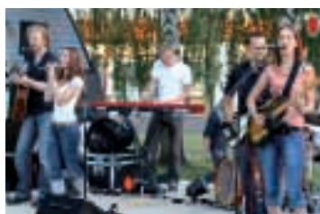
Unterhaltung: Eine Band sorgte für die entsprechende Stimmung