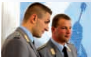
Gemeinsam Olympiasieger, Kevin Kuske und André Lange

Seine Sportlerkarriere hatte André Lange nach den Olympischen Winterspielen eigentlich schon beendet. Trotzdem hat er jetzt noch einen weiteren Titel gewonnen, den des Champion des Jahres. 68 deutsche Spitzensportler hatten sich in einer Wahl für den Bob-Piloten entschieden.