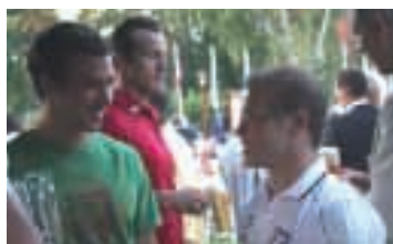
Fachsimpeln: Der Skiläufer Felix Neureuther und Fabian Hambüchen