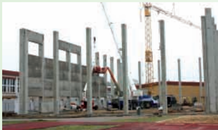
Etappen des Baues der neuen Dreifelderhalle, die vor Kurzem ihrer Bestimmung übergeben wurde.