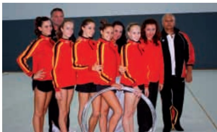
Das komplette Aufgebot in der Rhythmischen Sportgymnastik für die WM in Moskau samt Trainerinnen, Ballettmeister und Physiotherapeut

"Sie opfern viel von ihrer Freizeit für den Sport, üben sich in starker