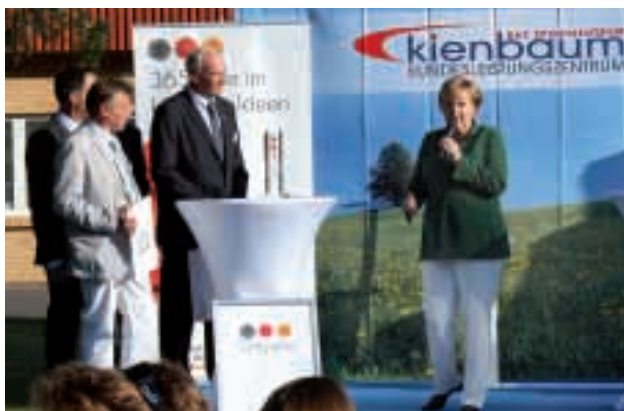
Die gut gelaunte Bundeskanzlerin am Mikrophon: Angela Merkel lobte die phantastische Anlage und die tollen Mitarbeiter.

Es ist hier ein tolles Objekt. Herzlichen Glückwunsch.