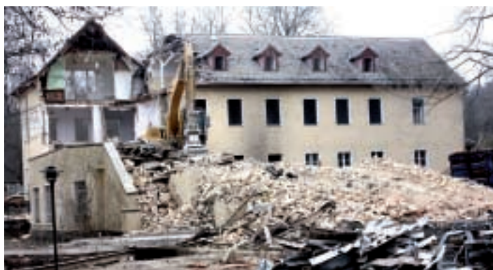
Abriss! Der Bagger zerlegt das alte Verwaltungsgebäude