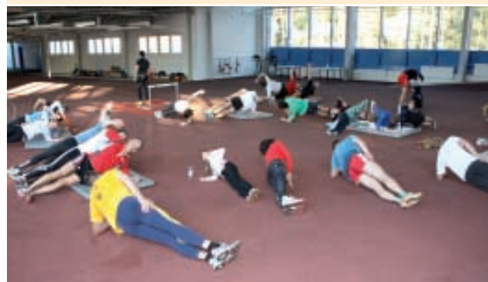
Auch die Triathleten nutzen Kienbaum zur Saisonvorbereitung. Hier sind es die Männer und Frauen vom Berliner Seesport-Club Grünau. Ihr Ziel ist ein gutes Abschneiden in der zweiten Bundesliga.

Einen schöneren Abschluss ihrer langen und so erfolgreichen Karriere hätte sich Steffi Nerius gar nicht wünschen können. Sie wurde von mehr als 1400 Fachjournalisten zur Sportlerin des Jahres 2009 gewählt, was gleichzeitig eine Verbeugung vor ihrer großartigen Leistung bei der Weltmeisterschaft im Berliner Olympiastadion war, wo sie sich den Titel holte.