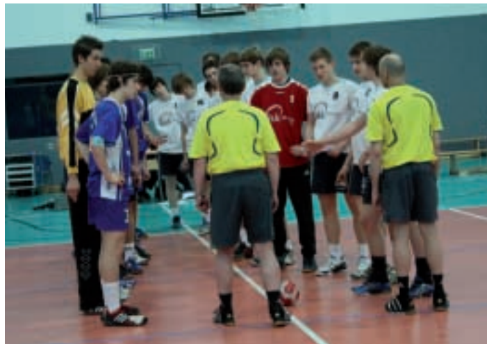
Ganz offiziell: So wie es sich gehört, begrüßten sich die jungen Handballer auch in Kienbaum vor ihren Testspielen

Umbruch befindet." Und weiter erklärte Schwarzer, der sich bei den Spielen der einzelnen Verbands-Vertretungen eifrig Notizen machte: "Mit unseren bekannten Tugenden wie Wille, Ehrgeiz, Kampf und Einsatz ist allein kein Blumentopf mehr zu gewinnen. Deshalb müssen wir Wert auf andere Komponenten legen. Das ist die Botschaft gewesen, die ich den hier anwesenden Jugendlichen und ihren Trainern vermitteln wollte."