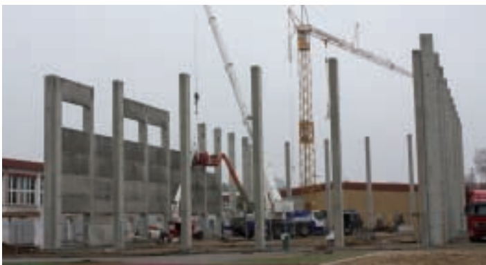
Neubau! Hier entsteht eine weitere Dreifelderhalle