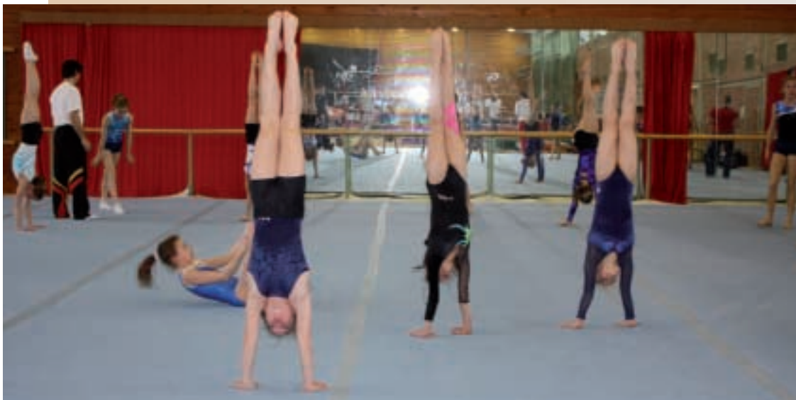
Ehe die große Sichtung in der weiträumigen Halle begann, wurde noch einmal fleißig der Handstand geübt, stets aufmerksam beobachtet von der Bundestrainerin Ulla Koch und Flavio Bessi (kleines Bild)

Als Schwerpunkte ihrer Arbeit für dieses Jahr sieht Ulla Koch die Erhöhung der Schwierigkeitsgrade und die Verbesserung der technischen Ausführungen der Übungen an, wobei auch die konditionellen Voraussetzungen eine große Rolle spielen. Und die Cheftrainerin hofft darauf, dass von unten etwas nachwächst. Nicht zuletzt aus diesem Grunde fand der Eignungstest statt.