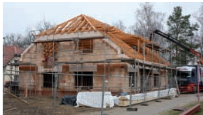
Ersatzbau! Zwei neue Pavillons