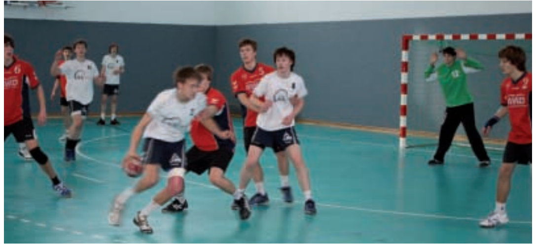
Angriff und Abwehr, das wurde immer wieder von den Jugendlichen gefordert

"Als ich mich in Innsbruck von Bundestrainer Heiner Brand verabschiedete, gab der mir mit auf den Weg, dass ich besonders Ausschau nach Talenten halten sollte, die über ein gutes Spielverständnis verfügen. Denn daran haperte es zuletzt bei unserer Nationalmannschaft, so dass wir über einen zehnten EM-Platz nicht hinauskamen, was für uns alle eine Enttäuschung war, wengleich man berücksichtigen muss, dass sich das Team im